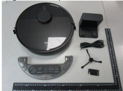
Imagem a cores do produto:

Dreame (Tianjin) Information Technology Co.,Ltd. Room 2112-1-1, South District, Finance and Trade Center, No.6975 Yazhou Road, Dongjiang Bonded Port Area, Tianjin Pilot Free Trade Zone, Tianjin, P.R.China Suzhou China 2021.10.20